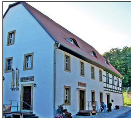
Beispiel aus der Förderperiode 2007 bis 2014 – Dietrichs Kaffeerösterei und Senfmühle in Pappendorf/Striegistal www.dietrichs-kaffee.de

Für beide Termine werden auch wieder Gelder für die Um- und Wiedernutzung leer stehender, ländlicher Bausubstanz zu Verfügung stehen. Interessenten können sich auf der Internetseite www.klosterbezirk-altzella.com oder direkt beim Regionalmanagement informieren.