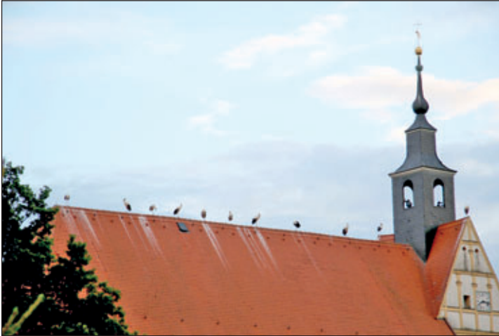
Da wird es aber Geburten und Taufen geben...