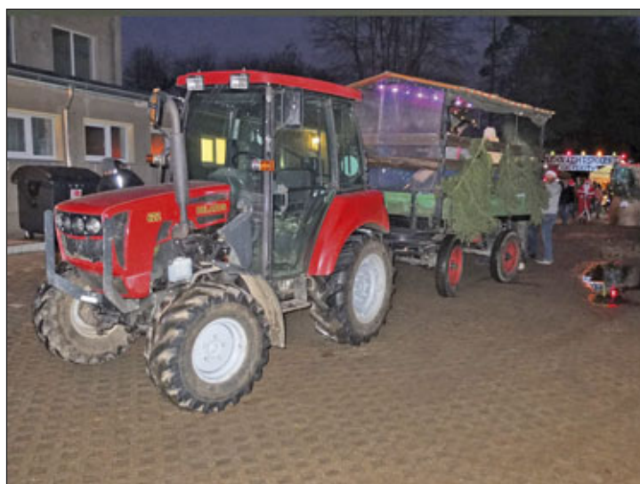
nächtliche Fahrt mit dem Kremser durch unser schönes Dorf