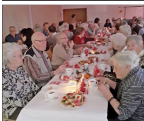
Geselliges Beisammensein bei Kaffee und Kuchen

konnte der Kindergarten vor dem vollbesetzten Saal sein Weihnachtsprogramm aufführen,