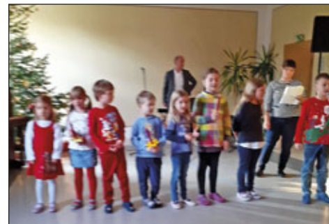
Auftritt der Kinder aus dem Kindergarten „Zwergenstübchen“

konnte der Kindergarten vor dem vollbesetzten Saal sein Weihnachtsprogramm aufführen,