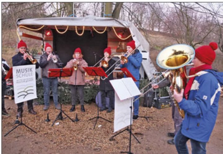
Auftritt der Blaskapelle auf dem Weihnachtsmarkt

Gekitzelt vom Duft der frisch gebackenen Waffeln unseres Handballnachwuchses ging es entlang des heimischen Nadelbaums weiter zum Ausschank der Freiwilligen Feuerwehr. Mit Glühwein in der Hand, vom Feuer etwas aufgewärmt, lauschte man dem Auftritt unseres Kindergartens mit Liedern aus der Adventszeit.