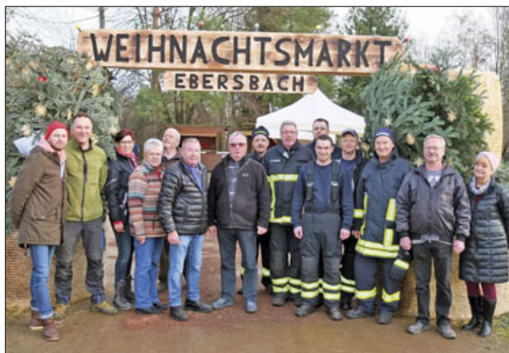
Helfer, Sponsoren, Vereine unterm Eingangsschild zum Weihnachtsmarkt

Vielen Dank an alle Helfer, Sponsoren, Vereine, Gestalter des Eingangsschildes, Züchter des Weihnachtsbaums sowie den Organisatoren, die den Ablauf unterstützt und den Weihnachtsmarkt möglich gemacht haben.