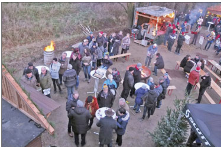
Besucher des Weihnachtsmarktes

Mit ein paar Strohbällen und einem wunderschönen Eingangsschild mit der Aufschrift „Weihnachtsmarkt Ebersbach“ wurde der Eingangsbereich gestaltet. Von da an tauchte man ein in die kleine Weihnachtswelt von Ebersbach.