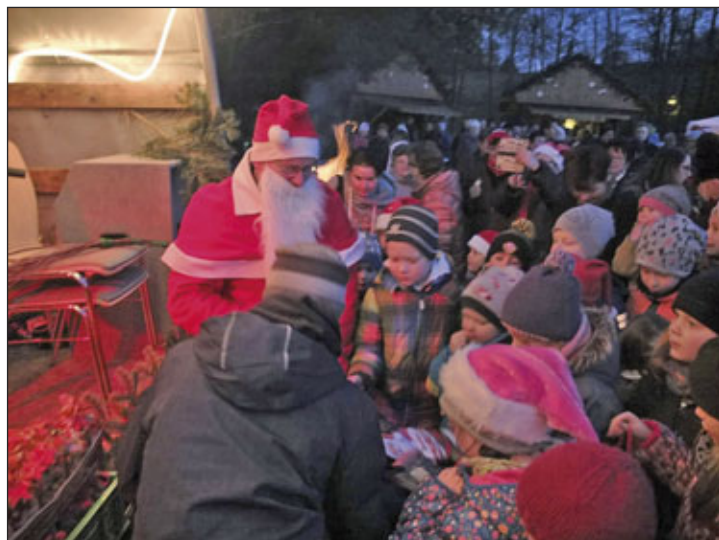
Besuch des Weihnachtsmannes zum Verteilen der Geschenke

Auf Grund der positiven Resonanz, soll dieses Erlebnis für 2020 wieder nach Ebersbach geholt werden.