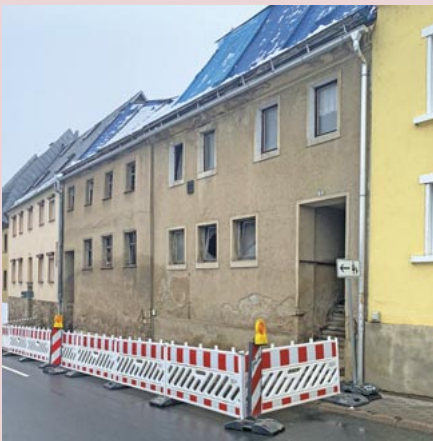
Im unteren Bereich der Oschatzer Straße ist eine halbseitige Sperrung erforderlich. Von zwei Gebäuden in dem Bereich geht eine akute Gefahr aus.

Bereits in der Vergangenheit wurde der Privateigentümer der Immobilien mehrfach aufgefordert, seinen Pflichten nachzukommen und die Häuser ordnungsgemäß zu sichern. Dies ist nicht im ausreichenden Maße geschehen, so dass nun akute Gefahr für alle, die diesen Bereich passieren, besteht. Auf Grundlage des Gutachtens eines Statikers wird die Stadt eine Ersatzvornahme durchführen. Die dafür notwendigen Schritte werden derzeit vorbereitet. Die Kosten werden dem Eigentümer in Rechnung gestellt. (tm)