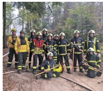
Ende Juli bis Anfang August halfen einige Kameraden in der Sächsischen Schweiz.