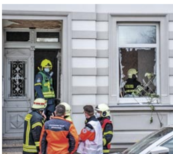
Am 3. Januar 2022 kam es zu einer Explosion im Haus Nr. 33 an der Schillerstraße.

Am 17. September 2022 veranstaltete die Ortswehr auf dem Feuerwehr-Gelände einen Action Day. Im Rahmen dessen sind die Ende 2020 erworbene neue Drehleiter sowie das Tanklöschfahrzeug feierlich übergeben worden. „Die Feier war coronabedingt entfallen und wurde 2022 nachgeholt“, begründet Heiko Hentzschel. Erstmals gab es für die beiden Fahrzeuge auch Taufpaten: Thomas Harnisch für die Drehleiter, Helmut Lagies für das TLF. Vom 4. zum 5. November 2022 absolvierte die Jugendwehr einen 24-Stunden-Dienst. Am 10. Dezember 2022 betreute der Nachwuchs zudem einen eigenen Stand auf dem Döbelner Weihnachtsmarkt. (mf)