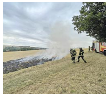
Vermeehrt mussten die Kameraden im trockenen Sommer Flächenbrände löschen.