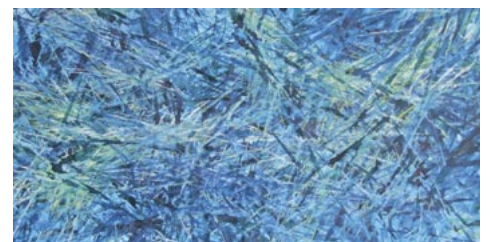
Kerstin Franke-Gneuß: Verwegenheit und Reue, in Tusche, Acryl und Pastell, aus dem Jahr 2018.

► Weihnachtsausstellung , Stadtmuseum, 1. Dezember 2023 bis März 2024 (in Planung)(mf)