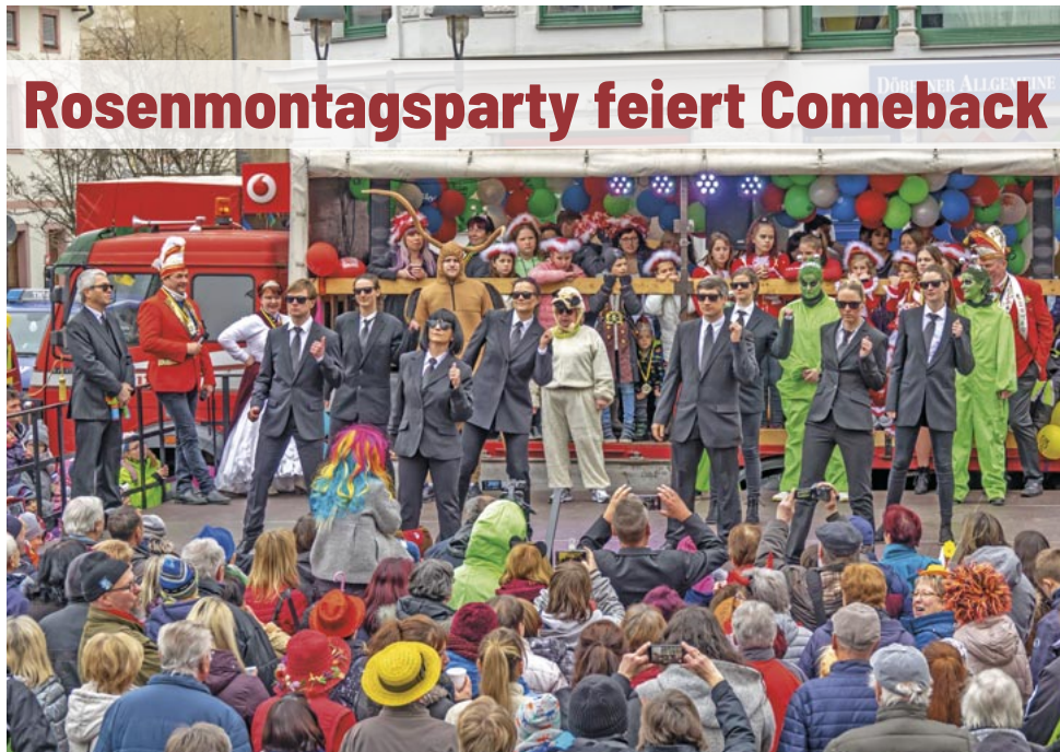
2020 traten die Rathausnarren als „Men in Black“ auf. Seien Sie gespannt, welchen Auftritt das närrische Volk in diesem Jahr auf's Parkett bringt. Zwei Jahre lang pausierte der Rosenmontagsumzug aufgrund der Pandemie.

Döbeln. Alle Närrinnen und Narren in und um Döbeln sind am 20. Februar 2023 herzlich zur großen Rosenmontagsparty auf den Obermarkt eingeladen. Los geht's um 15 Uhr mit viel Show, Spiel und Spaß. Mit dabei sind die Faschings- und Karnevalclubs aus Haßlau, Limmritz, Westewitz und Zschaitz-Ottewig. Darüber hinaus feiern mit das närrische Volk der Stadtwerke, der Veolia, des Klinikums Döbeln, der Wohnungsgenossenschaft „Fortschritt“, des Theaters, des Technischen Hilfswerks, der Jugendfeuerwehr, des Old Town Pub, des Landhotels „Sonnenhof“ Ossig, der Firma Lemke Catering – und mittendrin die Rathausnarren.