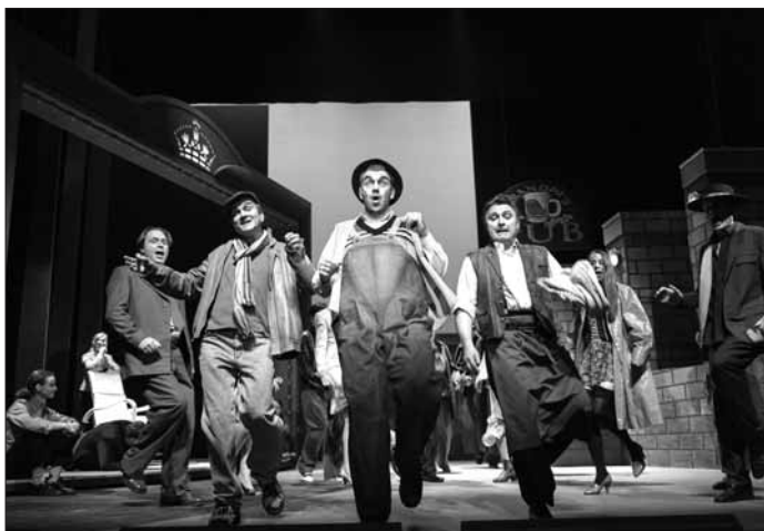
Szene aus „My Fair Lady“

Mit einem Musical, das im September auch die Saison eröffnete, verabschiedet sich das Döbelner Theater in die Sommerpause: „My Fair Lady“ steht am Samstag, den 8. Juni um 19.30 Uhr noch einmal auf dem Spielplan.