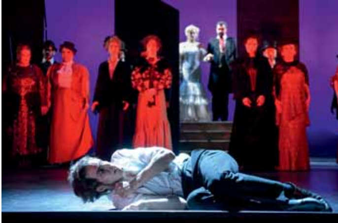
Szene aus Jekyll & Hyde