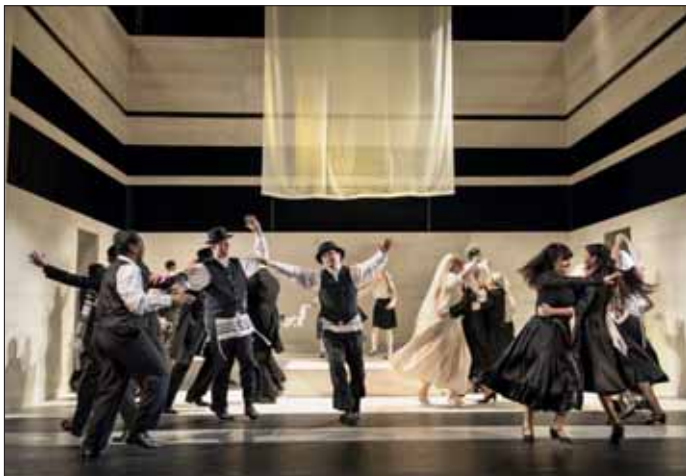
Noch ahnt keiner das bevorstehende Unheil – Hochzeitszene in „Anatevka“