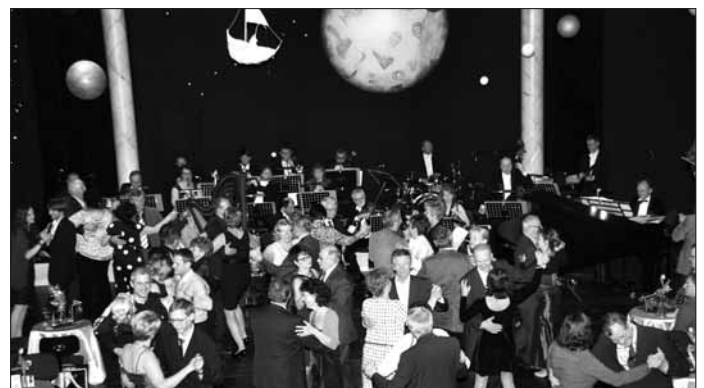
Tanzen auf der Theaterbühne – zur Einstimmung gibt es Tanzkurse im TiB

Der Theaterball am 25. März wirft seine Schatten voraus: Im Theater wird es dann wieder in verschiedenen Räumen die Möglichkeit geben, zu Live-Musik zu tanzen. Zur optimalen Vorbereitung bietet das Theater an den zwei vorhergehenden Wochenenden Tanzkurse im TiB an: am Samstag, dem 11.03.17, um 15.00 Uhr, am Sonntag, dem 12.03.17, um 11.00 Uhr und am Samstag, dem 18.03.17 um 15.00 Uhr. Karten zum Preis von 5,- Euro gibt es an der Theaterkasse.