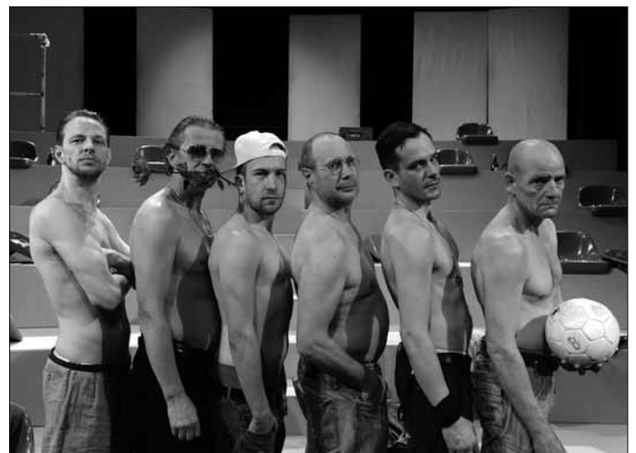
Szene aus „Männer“