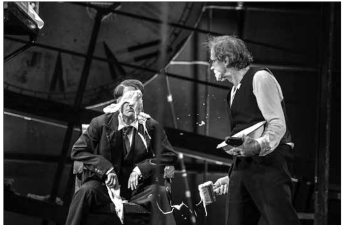
Szene aus „Mein Kampf“