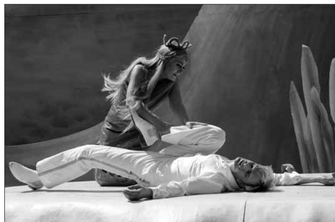
Szene aus „Undine, die kleine Meerjungfrau“

Um 10.00 Uhr wird die Inszenierung von Arnim Beutel in der Ausstat- tung von Peter Sommerer am 27. und 28. Mai sowie am 1. Juni gezeigt.