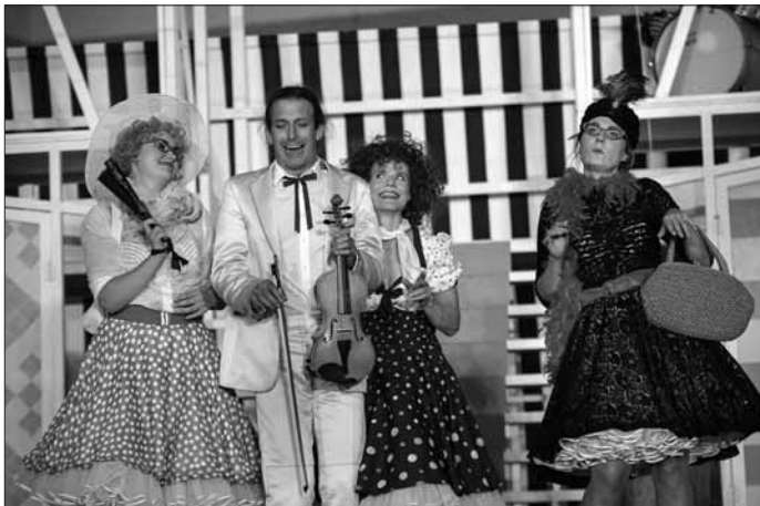
„Die Wirtin“