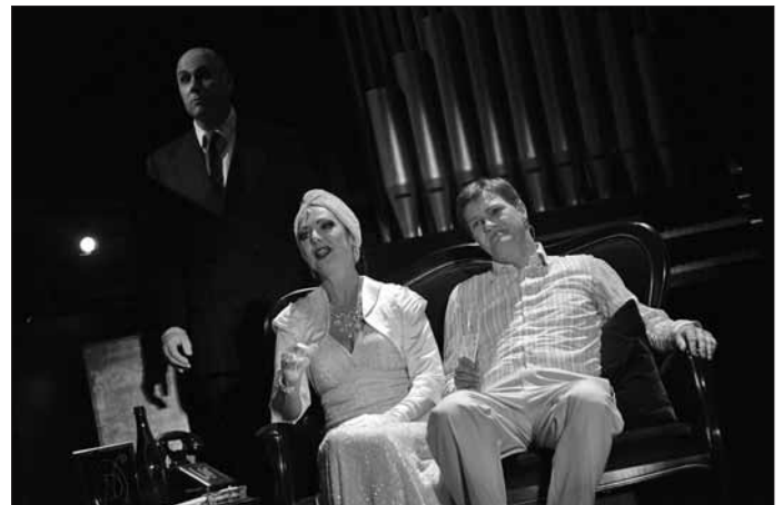
„Sunset Boulevard“