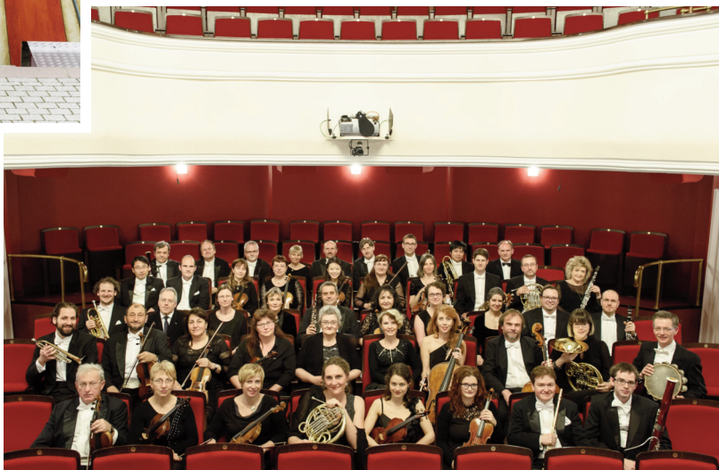
Die Musiker der Mittelsächsischen Philharmonie