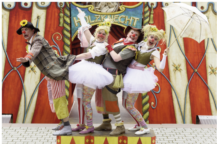
Szene aus „Der kleine August“

Am Wochenende darauf, am Samstag, dem 24. und am Sonntag, dem 25. August, jeweils um 16.00 Uhr heißt es noch einmal „Herrrrrrrrrrreinspaziert!“ in die Manege an der Seebühne. In Pavel Kohouts Zirkusmärchen „Der kleine August“ gelingt es dem Titelhelden mit grenzenloser Fantasie, alle Hindernisse aus dem Weg zu räumen und seine Träume gegen Zirkusdirektor Holzknecht und den arroganten Stallmeister durchzusetzen.