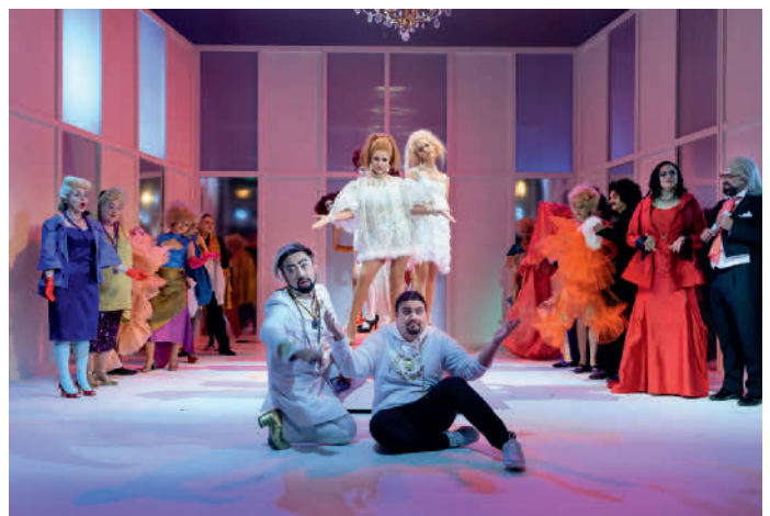
Szene aus „Cendrillon“