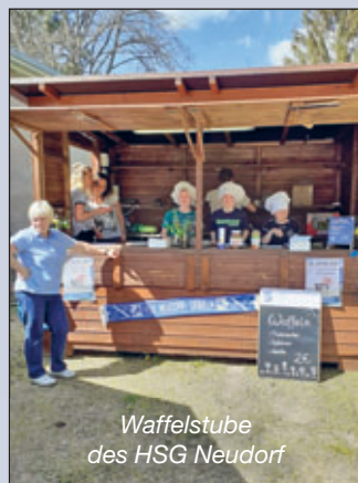
Waffelstube des HSG Neudorf