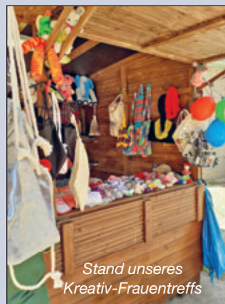
Stand unseres Kreativ-Frauentreffs