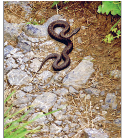
Kreuzotter ( Vipera berus )