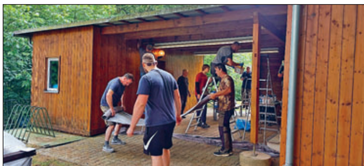
Neuer Anstrich für's Vereinsheim