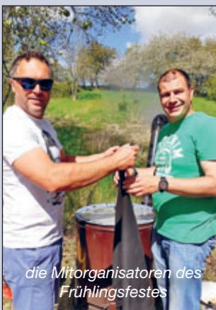
die Mitorganisatoren des Frühlingsfestes