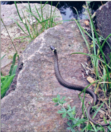
Die Ringelnatter ( Natrix natrix )