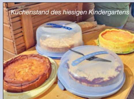
Kuchenstand des hiesigen Kindergartens