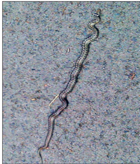
Glattnatter ( Coronella austriaca )